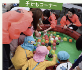
子どもたちが主役のコーナーも!

さらにイートインスペースも用意され、のんびりゆったり満喫できるのもうれしい。目の前に広がる美しい海や春の草花を眺めながら、熱海ならではの催しやグルメを楽しんでみてはいかが。