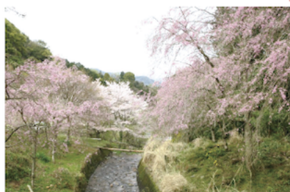
※「しだれ桜まつり」は開花状況で変更の可能性あり。詳細は多賀観光協会へ。