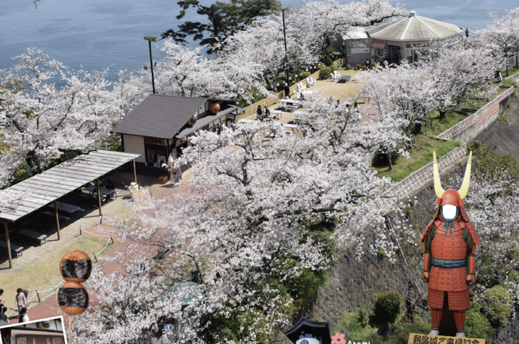
熱海城ご来場記念