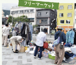
会話を弾ませて、フリーマーケットでお買い物。景色を眺めながらグルメも堪能しよう。