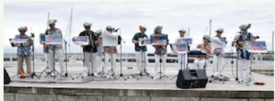
(上) 会場の様子。(下) ステージ企画もいっぱい。写真は、中銀の入居メンバーで結成された「来の宮アイランダーズ10」によるウクレレ演奏。

さらにイートインスペースも用意され、のんびりゆったり満喫できるのもうれしい。目の前に広がる美しい海や春の草花を眺めながら、熱海ならではの催しやグルメを楽しんでみてはいかが。