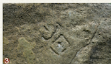
①春は、城と桜の美しい景色が堪能できる。②豊川のほとりに建つ鉄櫓(くろがねやぐら)。③石垣刻印などの貴重な遺構も。