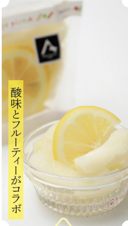
酸味とフルーティーがコラボ