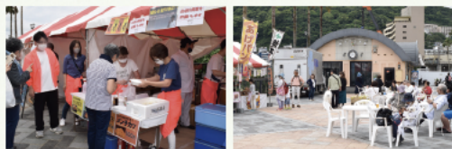
イートインスペースも設置され、のんびりグルメを堪能する姿も…

そして、子どもたちが主役のコーナーも大盛況。「パネルシアター」や「ヨーヨー釣り」「輪投げ」などが行われ、子どもたちの笑顔があふれていた。