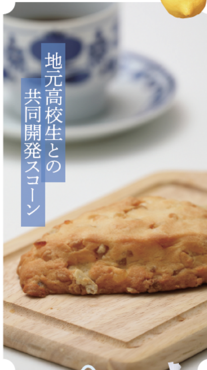
地元高校生との 共同開発スコーン