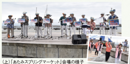
(上)「あたまスプリングマーケット」会場の様子 (下)「来の宮アイランダーズ10」によるステージ。フィナーレでは、「東京音頭」を演奏し、踊り子による「盆踊り」がステージに華を添えた

こうしたイベントを支えるスタッフの中には、中銀の入居メンバーの存在が大きい。心を込めたおもてなしを大切に、親切・丁寧に対応されている姿が印象的である。