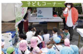
パネルシアターに集まった子どもたち

今回も子どもコーナーからフリーマーケット、名店の味まで、多彩な催しが登場しました