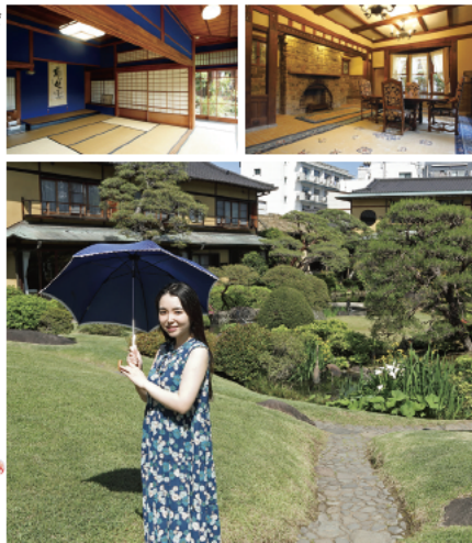
上:和洋折衷の館内 下:風情あふれる庭園