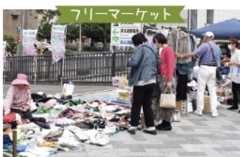
お気に入りの逸品出会えた人も多いのでは…。お土産に最適な市内の名店も登場