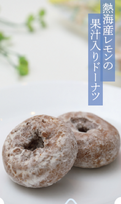
熱海産レモンの 果汁入りドーナツ